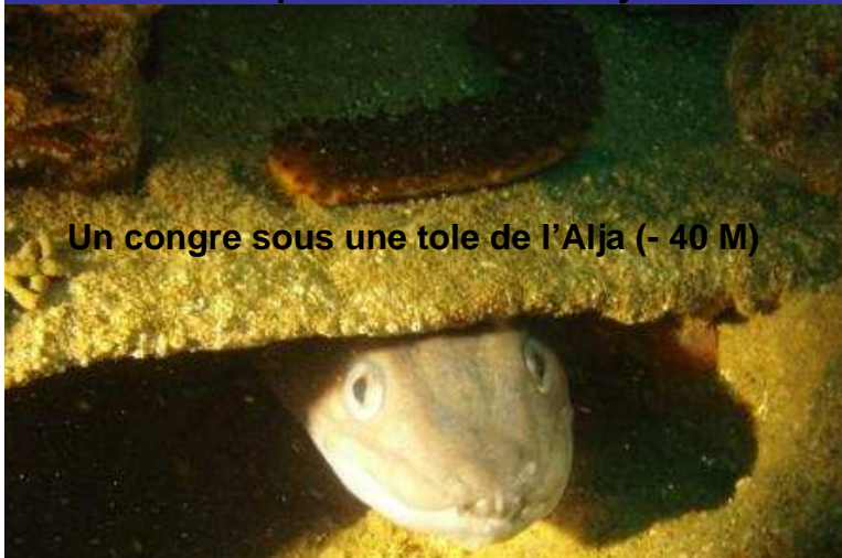
Un congre sous une toile de l'Alja (- 40 M)