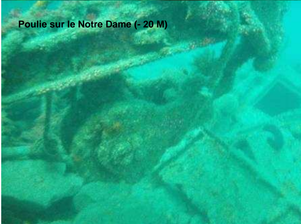
Poulie sur le Notre Dame (- 20 M)