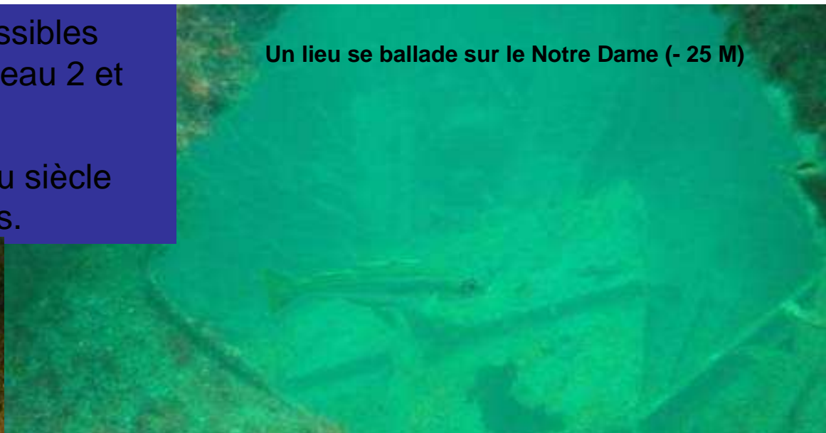
Un lieu se ballade sur le Notre Dame (- 25 M)