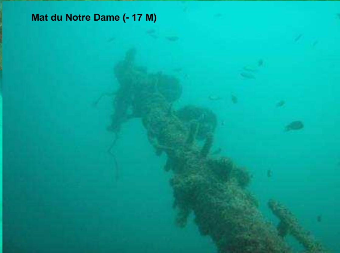
Mat du Notre Dame (- 17 M)